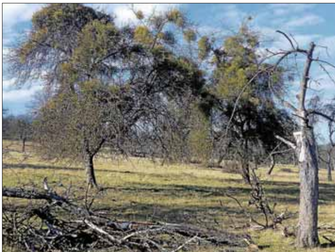
Mistelbefall im Streuobstgebiet Breite

Zu einem ersten Treffen im neuen Jahr 2018 kam die Hechinger Streuobstrunde jüngst im Rathaus zusammen. Themen waren