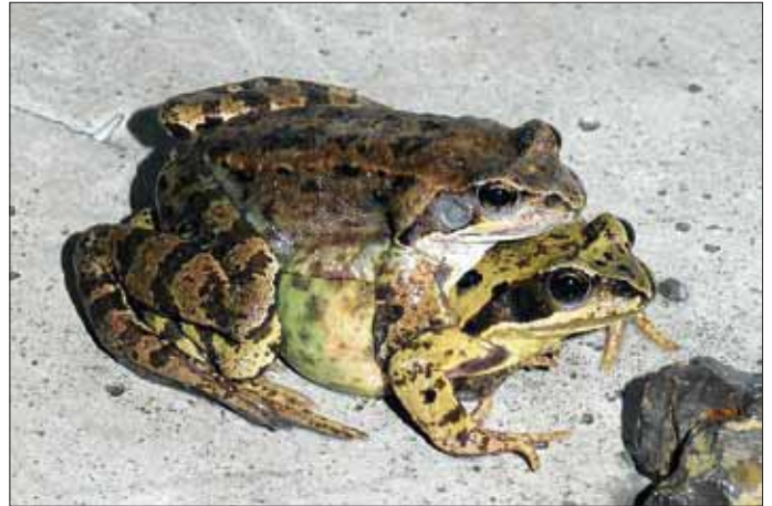
Auch der Grasfrosch wandert jetzt zu seinen Laichplätzen, die Art wurde zum Lurch des Jahres 2018 gekürt.

Aktuell beginnen wieder die Laichwanderungen von Kröten, Fröschen, Unken, Salamandern und Molchen. Die Amphibien streben dabei ohne Umweg ihrem angestammten Laichgewässer zu. Dabei wird vielen die Überquerung von Straßen zum Verhängnis. Die NABU-Gruppe Hechingen führt deswegen in Verbindung mit der Stadtverwaltung Hechingen mehrere verkehrsrechtliche Schutzmaßnahmen durch, insbesondere auf den Zufahrtsstraßen zum Lindich. Hier weisen Warn- und Tempo-30-Schilder auf die nächtlichen Aktivitäten hin, das Sträßchen zwischen dem Hauser Hof und Weilheim wird zum Teil ganz gesperrt.