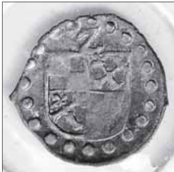
Zahlungsmittel vor 500 Jahren: ein zollerischer Schüsselpfennig

Sie hat nur einen Durchmesser von zehn Millimetern, die kleine Münze aus dem Jahr 1505. Sie ist aber das Highlight des 33. Großtauschtages der Hechinger Briefmarkenfreunde am 25. März in der Stadthalle Museum. Graf Eitel Friedrich II., der in Hechingen von 1488 bis 1512 regierte, ließ die "Münze der Zollernburg" im Jahre 1505 prägen. Sie trägt das Münzmeisterzeichen Z für Zollern über einem quadratierten Wappenschild. Es handelt sich um einen einseitig geprägten Schüsselpfennig und ist eine der Münzen, die in einer Ausstellung eines Mitglieds der Hechinger Briefmarkenfreunde zu finden ist.