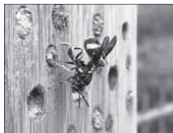
Erzwespe, Foto: Peter Faber

Mehr als 50 Interessierte fanden sich letzten Donnerstag im Bildungshaus St. Luzen ein, um sich von Peter Faber von der Hochschule für Wirtschaft und Umwelt in Nürtingen über Bedeutung und Schutz der heimischen Wildbienen berichten zu lassen. Wildbienen kommt - so der Referent - eine wichtige Funktion als "Bestäuber" zu. Sie sind teils leistungsfähiger als Honigbienen und zusammen mit anderen Insekten zu etwa zwei Drittel an der Bestäubung von Wild- und Kulturpflanzen beteiligt und daher unverzichtbar.