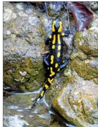
Lässt sich bei feuchter Witterung auch im Zollerwald entdecken: der Feuersalamander

Eine geführte Wanderung mit Uli Knoll an der Südseite des Zollerberges entlang findet am Sonntag, 25. März, statt. Treffpunkt ist um 14.00 Uhr am Wanderparkplatz ca. 400 m ortsauwärts auf der Zellerhornstraße.