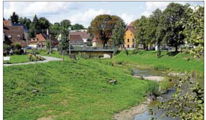
Das renaturierte Starzelsbett zwischen Mühlstraße und Schützenbrücke