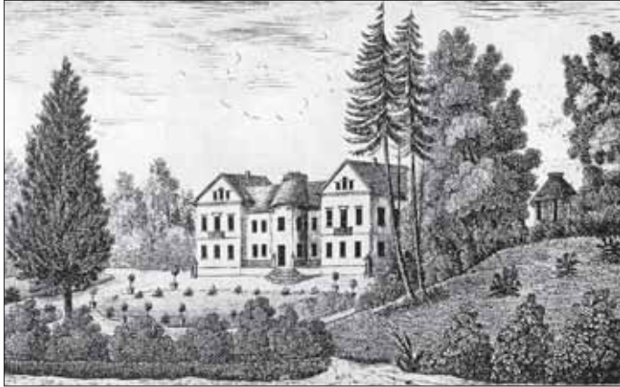
Spannend: eine Führung durch den Fürstengarten mit Landschaftsarchitekt Albrecht Schaal