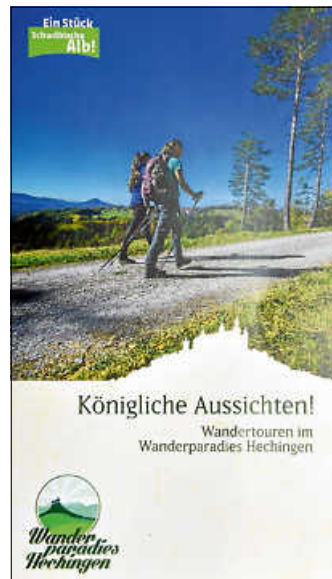
Die Broschüre zum Wanderparadies

Aktuell sind im Wanderparadies Hechingen fünf Touren unterschiedlichster Art ausgewiesen: Martinsberg-Tour, Heideweg-Tour, Kirchenköpfe-Tour, Römer-Tour (mit Spielstationen für Kinder) und Raichberg-Tour. Alle Informationen finden sich im Internet unter www.hechingen-tourismus.de . Dort kann auch unter "Service" die erwähnte 24-seitige Wanderbroschüre als PDF-Dokument heruntergeladen werden. Die Druckversion kann unter tourist-info@hechingen.de bestellt werden, sie wird kostenlos zugesandt.