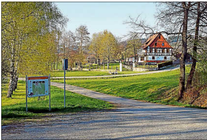
Eine Tafel beim Wanderparkplatz Hüttenwiesen enthält alle Infos zur Tour. Zum Parkplatz immer in Richtung Kolpingshütte fahren.

Das Sachgebiet Tourismus und Kultur der Stadt Hechingen, die Ortschaftsverwaltung Boll und der Schwäbische Albverein, Ortsgruppe Hechingen, sind sich indes sicher, mit der aktuellen und nunmehr offiziell freigegebenen Raichberg-Tour ein Kleinod erschlossen zu haben, das schnell zu einem "Geheimtipp" werden wird.