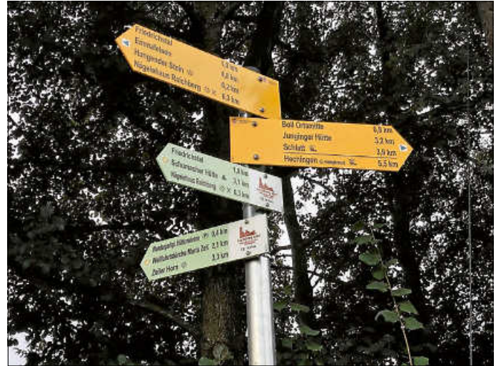
Die Raichberg-Tour ist mit hellgrünen Täfelchen samt Logo gekennzeichnet.

das Tal am Reichenbach entlang. Dort steht auch der 1805 von Fürst Hermann Friedrich Otto von Hohenzollern-Hechingen errichtete Obelisk. Seine Aufschrift zeugt von der Naturverliebtheit des Fürsten und kann als Leitspruch für die Wanderung genutzt werden: "Hier, wo der Einsame bey Dir, Natur, verweilt / wird ieder innre Schmerz von sanfter Hand geheilt."