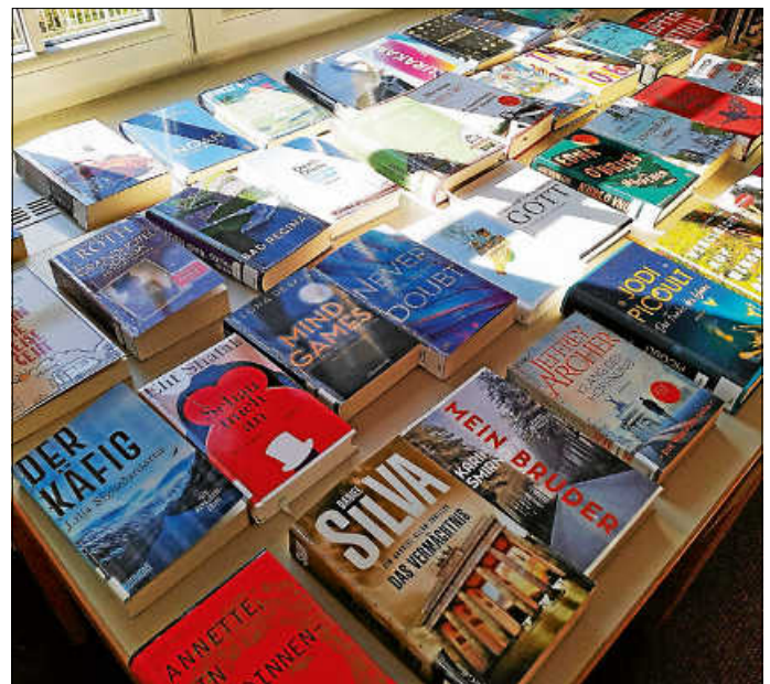
Begehrt: der Tisch mit den Neuerwerbungen

Die Stadtbücherei Hechingen bietet weiterhin den Besuch mit vorheriger Terminvereinbarung an. Somit ist es den Lesern und Leserinnen möglich, nach Anmeldung unter Tel. 07471 621806 zu einem festen Termin die Bücherei zu besuchen, um Medien abzugeben und neue Medien auszuleihen. Die Zeitfenster à 30 Minuten orientieren sich an den regulären Öffnungszeiten der Bücherei von Dienstag bis Samstag. Da die Anzahl der Besucher und Besucherinnen je Zeitfenster begrenzt ist, ist bei der telefonischen Anmeldung die Anzahl der Begleitpersonen zu nennen. Um die Dokumentation für die Kontaktnachverfolgung gewährleisten zu können, muss beim Betreten der Stadtbücherei außerdem ein entsprechendes Formular ausgefüllt werden.