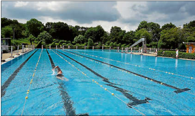
Ein einsamer Schwimmer zieht seine Bahn, die Regenwolken sind im Anzug.

Das Freibad hat seit Montag geöffnet, leider hat das Wetter bisher nicht mitgemacht. Öffnungszeiten, Preise und die corona-bedingten Regelungen finden sich im Internet unter www.hechingen.de/hallen-freibad .