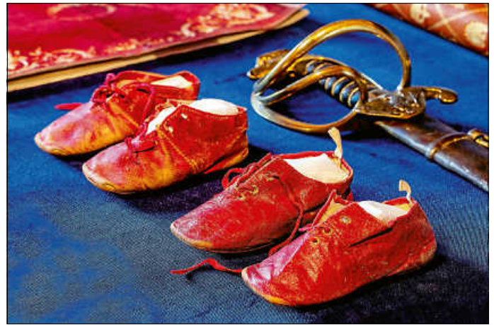
Neues gibt es auch in der Schatzkammer: königliche Kinderschuhe.

Alles in allem also gute Aussichten sowohl für Burgbesucher als auch für das Burg-Team. Und noch eine gute Nachricht: Am Montag, 21. Juni 2021, gastiert die American Drama Group mit Hamlet im Burghof - traditionell in Shakespeares englischer Originalsprache. Tickets gibt es in kontingentierter Anzahl über die Internetseite der Burg.