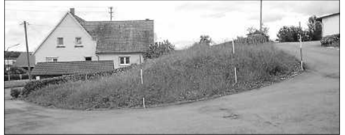
Noch vor sich eine Blühfläche zu werden hat die kleine Wiese am Kapellenweg.

„Das Geld für den 2. Defibrillator ist da“, verkündete der Hechinger Schultes am Schluss der Sitzung und bedankte sich herzlich für das ehrenamtliche Wirken der Ratsmitglieder.