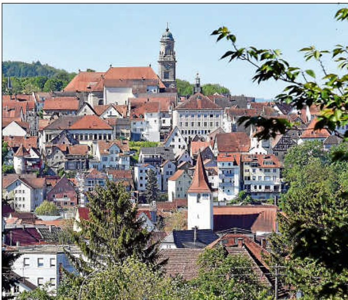
Wie soll sich die Zollernstadt entwickeln? Rekordverdächtige 1.082 Beiträge gab es bei der Online-Befragung zum ISEK.

1.082 - mit dieser ausgesprochen hohen Anzahl an Beiträgen endete am vergangenen Sonntag die dreiwöchige Online-Befragung zu den Maßnahmevorschlägen und der Thesendiskussion über Schlüsselmaßnahmen des zukünftigen Stadtentwicklungskonzepts. Von der Vielzahl der Rückmeldungen sind Stadtbau- und Stadtentwicklungsinhaber Helga Monauni und Norina Flietel vom Planungsbüro Wüstenrot positiv überrascht: „Herzlichen Dank an alle Hechingerinnen und Hechinger, die an der Befragung teilgenommen haben und damit die Erarbeitung des Stadtentwicklungskonzeptes unterstützt haben.“