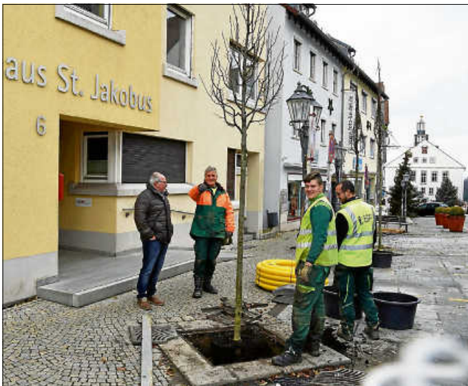
Zehn neue Hainbuchen wurden gepflanzt.

Um die Stadtbäume am Kirchplatz und rund um die Stiftskirche St. Jakobus (es handelte sich um eine Weißdornart) war es in letzter Zeit nicht gut bestellt: Diese kümmerten vor sich hin oder waren zum Teil schon entnommen worden. Aktuell sind Mitarbeiter der Firma Zanger im Auftrag des Sachgebiets Tiefbau der Stadt dabei, die Bäume gegen zehn neue Hainbuchen auszutauschen, auch zur Abrundung und als Fortführung der Bepflanzung des neu hergestellten Obertorplatzes. Ganz bewusst wurde mit der Hainbuche eine heimische und langsam wachsende Art ausgewählt, denn zu groß sollen die Bäume auch nicht werden. Die Hainbuche ist nur entfernt mit der Rotbuche verwandt. Der Name lautete ursprünglich „haganbuoche“ und verweist auf die Nutzung als lebendige Umfriedung (Hag = Hecke). Dafür ist die Hainbuche wegen ihrer Schnitfähigkeit bestens geeignet.