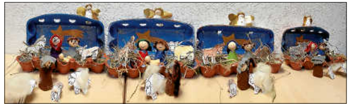
Krippen im Eierkarton

Im Kindergarten macht sich im Advent eine ganz besondere Stimmung breit: Die Kinder beginnen sich auf das anstehende Weihnachtsfest vorzubereiten. Es werden Plätzchen gebacken, Geschenke gebastelt und Lieder gesungen. Diese Zeit hat für Groß und Klein immer einen ganz wunderbaren Zauber inne. Wir wünschen Ihnen und Ihren Familien, dass dieser ganz besondere Zauber auch bei Ihnen Einkehr findet. „Die kleine Krippe im Eierkarton“ wurde von unseren Vorschülern gebastelt. Als Einstieg betrachteten die Kinder ein Bilderbuch von der Weihnachtsgeschichte. Anschließend überlegten sie, welche Figuren die Wichtigsten sind. Im Mittelpunkt stehen natürlich das Jesuskind, Maria und Josef. Jede Krippe wurde ein ganz besonderes Unikat.