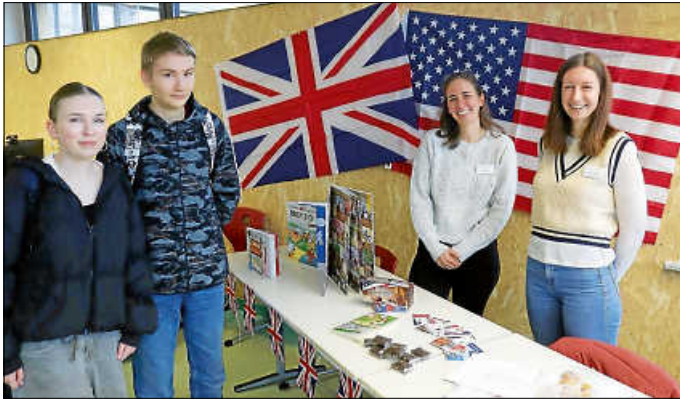
Die Fachschaft Englisch